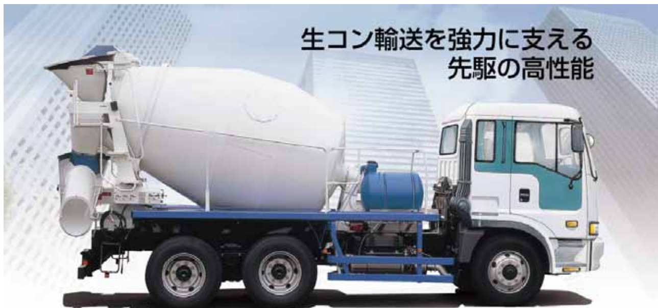
※写真のホッパカバーはオプション仕様